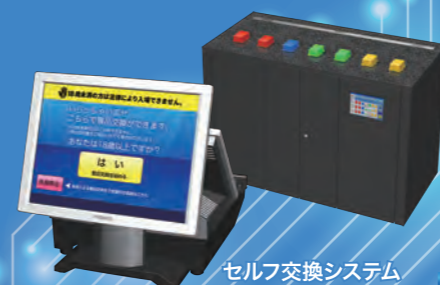
セルフ交換システム 2019