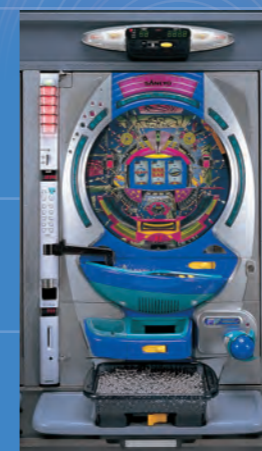
初代パーソナルシステム 1996