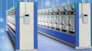
立体Air紙幣搬送システム 2014