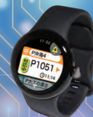
接客サポートシステム マーススマートウォッチ 2011