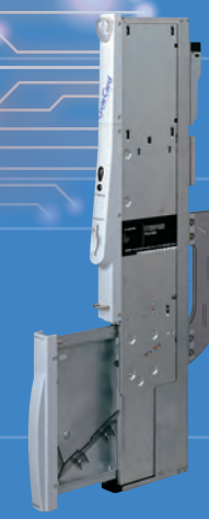
サイクルIC カードユニット 2000