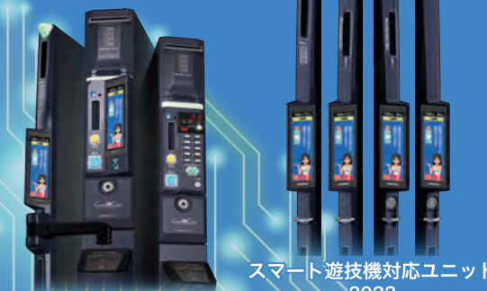
スマート遊技機対応ユニット 2022