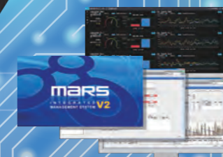
ユニコン パーソナルPCシステム 2017