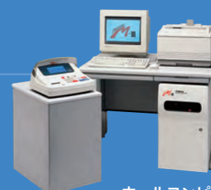
ホールコンピュータ MAGMA-III 1994