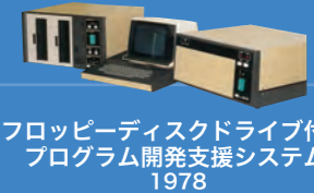
フロッピーディスクドライブ付き プログラム開発支援システム 1978