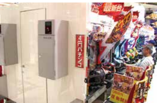
Air紙幣搬送システムは島端ごとに金庫があるタイプ