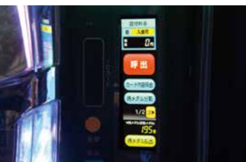
ボタンも大きく押しやすいスマスロ用のユニット