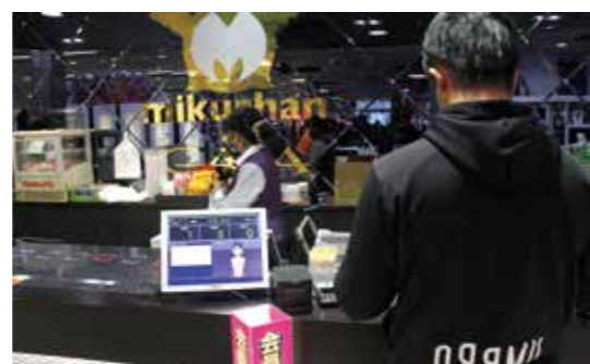
セルフ交換POSが使える会員専用景品カウンター