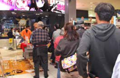
来店客向けサービスに中央通路に長蛇の列ができた