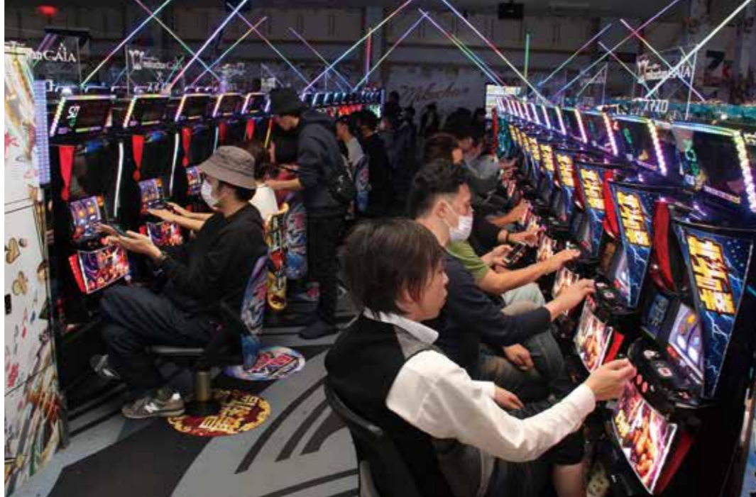
レーザー光で常に賑わい感が体感できるスマスロコーナー