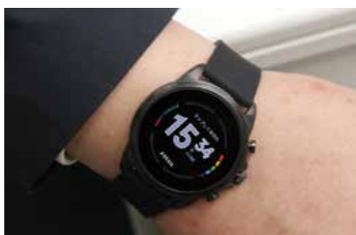
タップするとさまざまな情報が表示されるスマートウォッチ