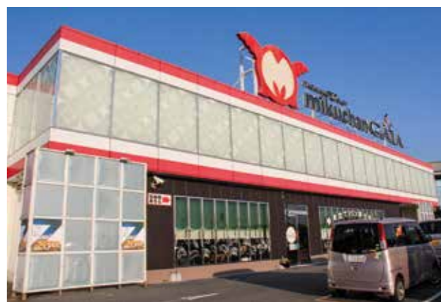
ミクちゃんガイア三木南店 総台数754台 ▽パチンコ:4円(250個) 324台、1円(1000個) 120台 ▽パチスロ:20円(47枚) 230台、5円(188枚) 80台